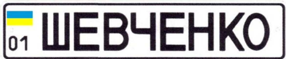
Рисунок А.б — Знак типу 6

UA — символ державної належності; 22 — код адміністративно-територіальної належності; 8320 — порядковий номер; AB — літеросполука, що позначає серію.