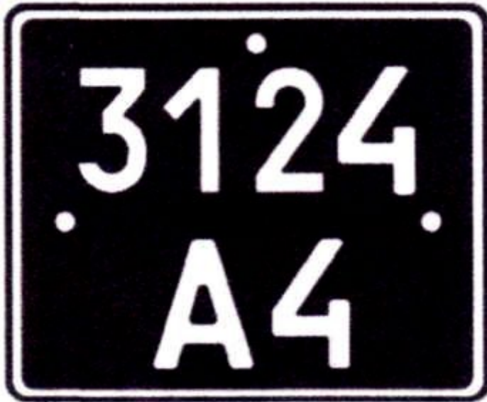
Рисунок А.10 — Знаки типу 10