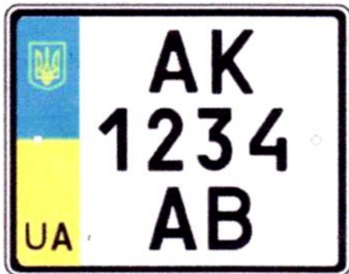
Рисунок А.4 — Знак типу 4

цифри 300—399 означають код держави консульської установи.