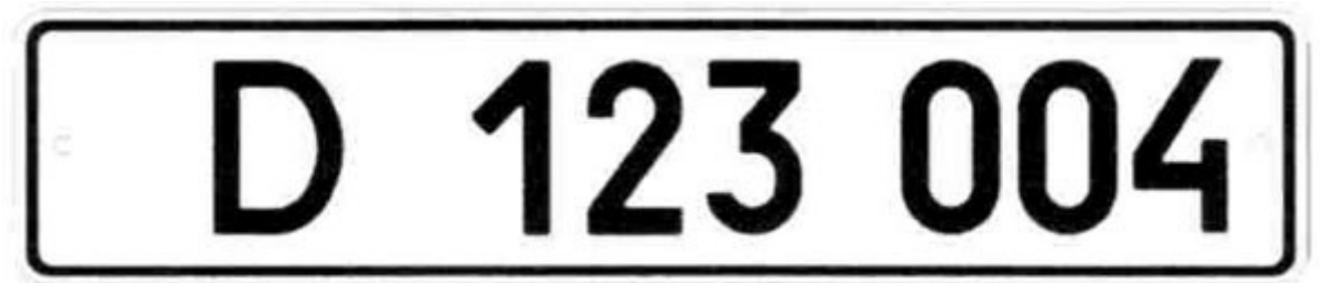
Рисунок А.3 — Знак типу 3