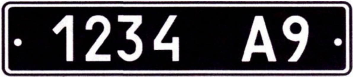
Рисунок А.9 — Знаки типу 9