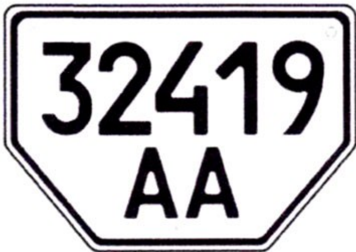
Рисунок А.7 — Знаки типу 7

32419 — порядковий номер; AA — літеросполука, що позначає серію.