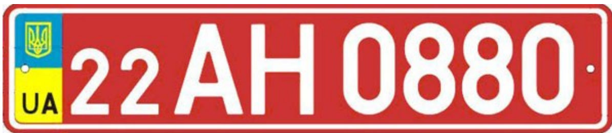
Рисунок А.1 — Знак типу 1

UA — символ державної належності; 22 — код адміністративно-територіальної належності; AH — літеросполука, що позначає серію; 0880 — порядковий номер.